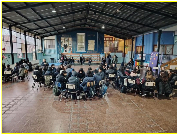
Taller manejo de la ansiedad y el estrés con Preuniversitario Pedro de Valdivia para 3° y 4° medio