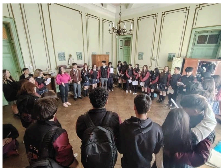
Jornada Cierre 4° medio