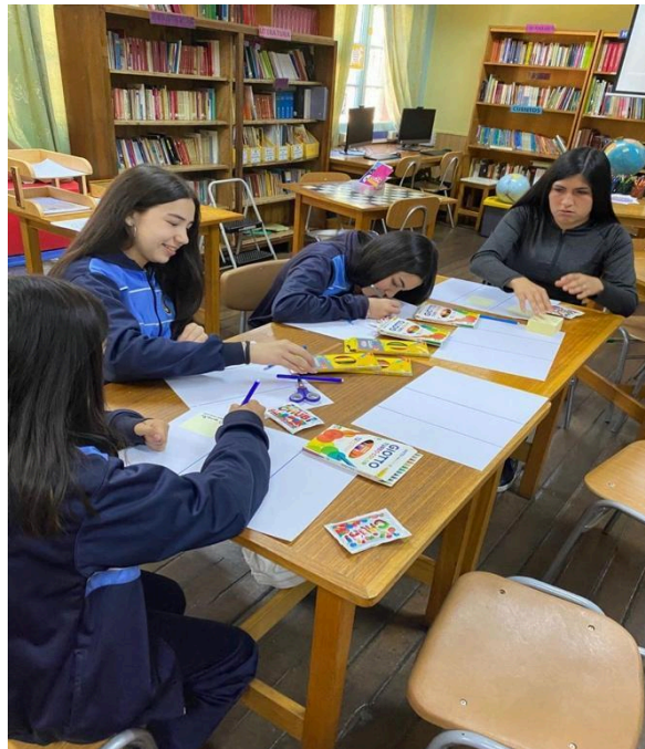
Taller Comunicación efectiva Embajadoras de la Buena Convivencia para 7° básico y 8° básico